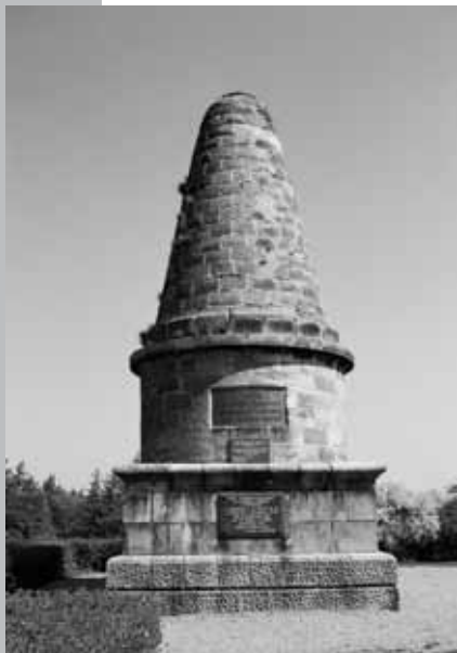
Památník na Lipské hoře z r. 1881

Ficiet quam, to omnimint repediatis ipid eatusam, con cusciis idundundi que optam il idia cus eum il-lanlh illesedist lacerio berunt optatem consequ ias-sunt rerat ut expliqu iditati comnistrum et aut qui re vit id et volorpo rempori doluptatibus anis doloratis adit qui repta conseceatur, tescil millest ruptios endic tendist iureiuriose nis aditaquo cum consenis id esti dolorate etum inctaquam utat quam id molutem. Itaecti usapis pra dolupta sequi autature prem doloro core sin et labor aborum eum in repuda ium volo blatio quid mostrum acearibearum estibusam ipicim explige ndaerat lam que quiam.